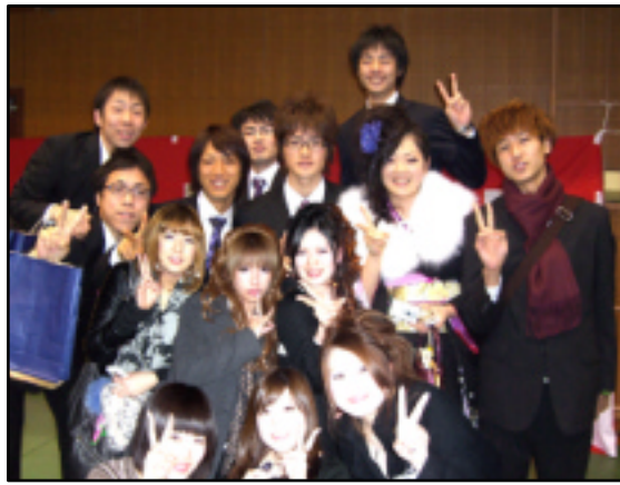
成人式に出席した喜びの新成人たち 八代総合体育館

成人になられた皆様、家族の皆様おめでとうございます。これからの日奈久の担い手となっていく新成人の皆さんは今後の自分の生き方、地域の在り方についてどんな考えをもっているのでしょうか。日奈久の新成人に、抱負や日奈久への思いを聞きました。 (取材 山中勇史)