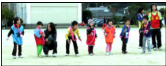
「ヨーイ!」1区(200m)を力走した未就学児童

元日の10時30分、大坪、新田、山下、竹ノ内、新開、塩北、塩南、浜の7町内が、日奈久中々農道周回コースの10区間11kmで寒風をうけてレースを展開。浜町が昨年に続いて優勝しました。