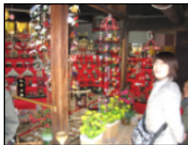
八代屋に勢揃いのお雛様と手作りの飾りもの