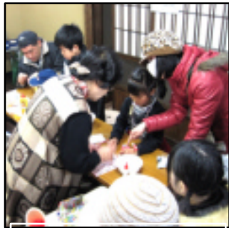
親子でかぐや雛作り体験 38人が参加