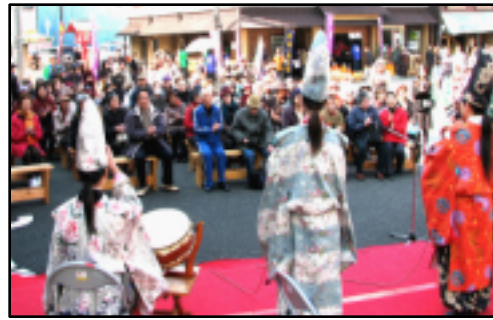
ひな人形のように着飾った秀岳館高校三味線部の演奏