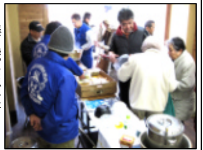
味が自慢のうまかもん市

2月21日(日)はお天気にも恵まれ、かぐや雛祭りが盛大に行われました。昨年まではお雛様を飾るだけ、旅館で食事を提供するだけでしたが、「日奈久温泉へお客様がもつと足を運んでくださるには...」と考え、市商政観光課協力のもとイベントが開催されました。地元以外からも多く