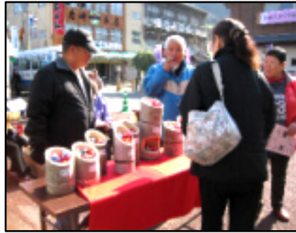
広場に展示のかぐや雛「かぐや姫みたい!」

町中では「スイーツ巡り」が女性に人気、数に限りが...と駆け足で急ぐ人も。「日奈久路地裏お雛めぐりツアー」には25名が参加。ボランティアガイドの皆さんが活躍しました。 お雛祭りは3月7日(日)まで開催、展示中です。