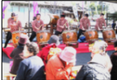
力強い六郎太鼓 小学生も熱演