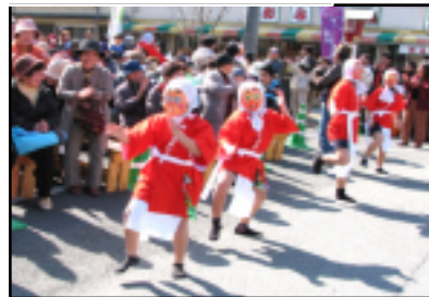
小学生も混じって愉快なひよっこ踊り