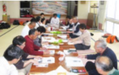
佐賀嬉野市塩田町職人組合から視察

日奈久まちづくり協議会は、「地域住民が主体となって誰もが誇りを持って安心して暮らせるまちづくり活動」をすすめていくことを目的としています。後日、会員募集の用紙をすべてのご家庭に配布いたします。